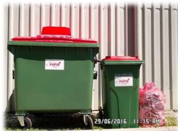
Slika 10: Zabojnik in vreča za zbiranje odpadnega papirja