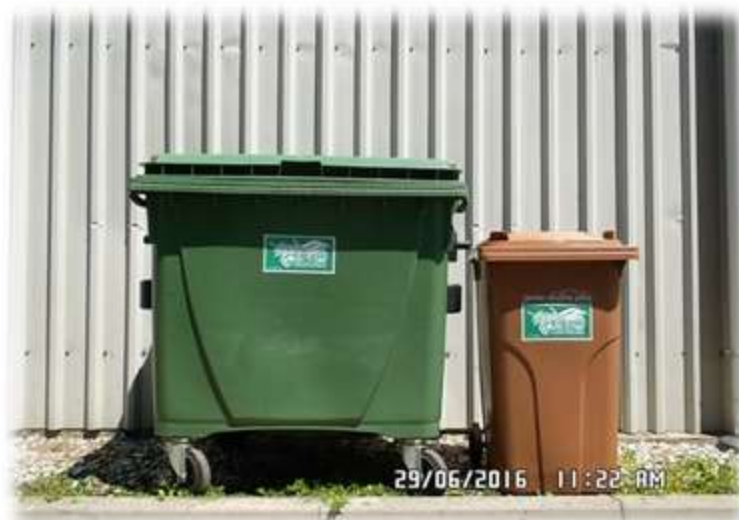
Slika 8: Zabojujnik za zbiranje bioloških odpadkov