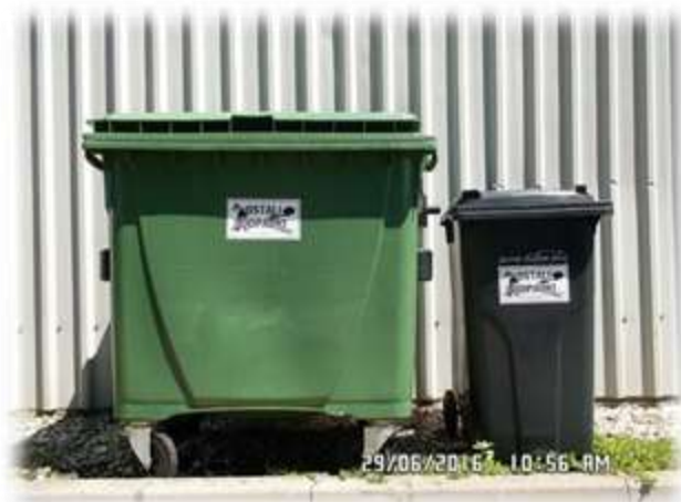
Slika 5: Zabojniki za zbiranje mešanih komunalnih odpadkov

Za prevzemanje in prevoz mešanih komunalnih odpadkov se uporablja specialno vozilo in sicer: