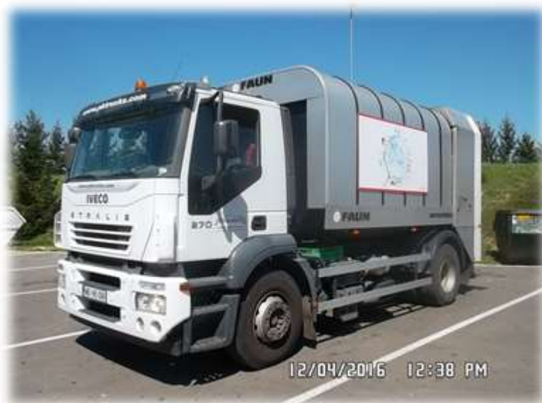
Slika 14: Vozilo za zbiranje odpadnega stekla

Za prevzemanje in prevoz steklene embalaže v zbiralnicah ločenih frakcij se uporabljajo vozila, ki so predstavljena na fotografiji 14.