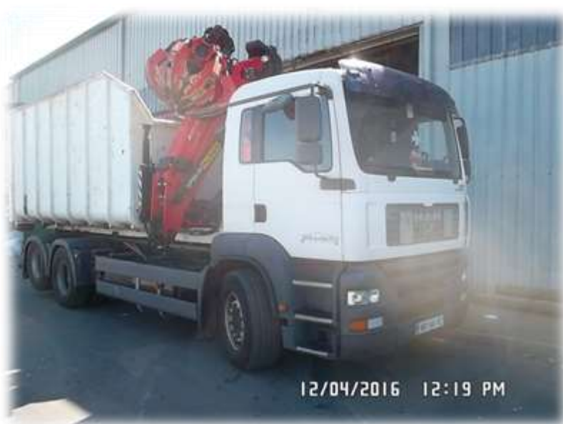
Slika 16: Vozilo za zbiranje odpadkov s kotalnih prekucnikov

Za prevzemanje in prevoz kosovnih odpadkov frakcij se uporabljajo kontejnerska vozila ter vozila za prevoz kotalnih prekucnikov.