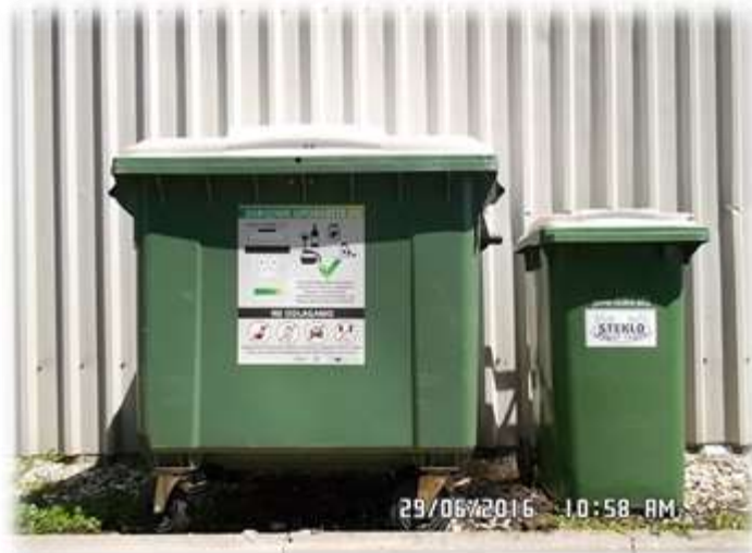
Slika 13: Zabojnik za zbiranje steklene embalaže