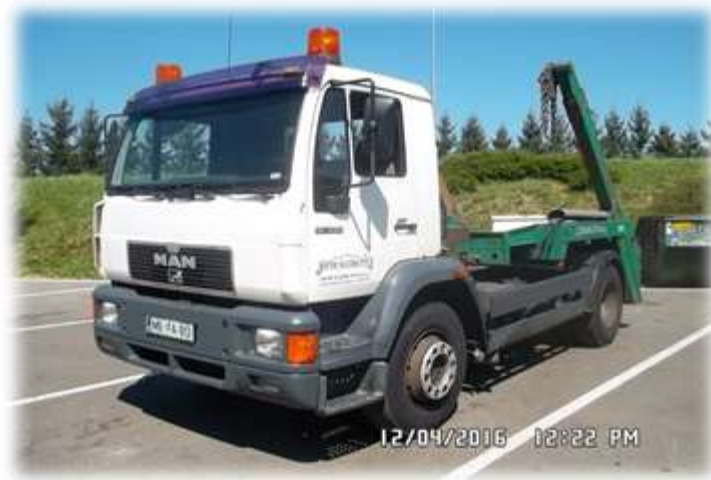
Slika 7: Vozilo za odvoz kontejnerjev manjših volumnov