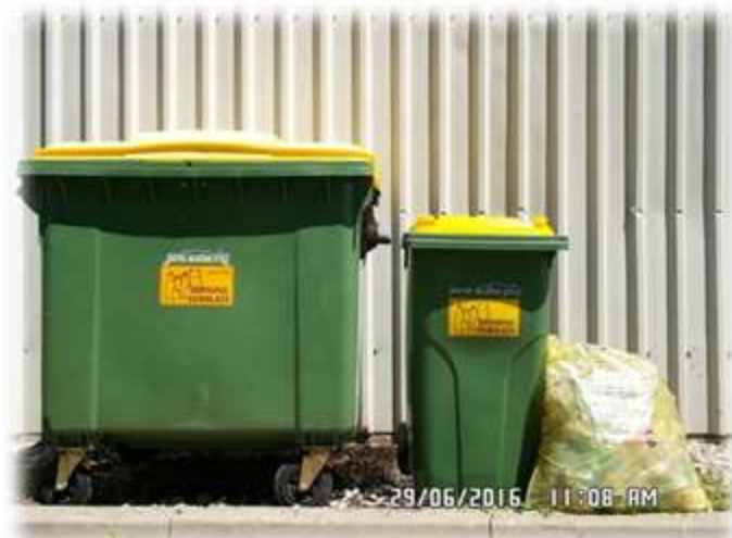
Slika 11: Zabojnik in vreča za odpadno embalažo