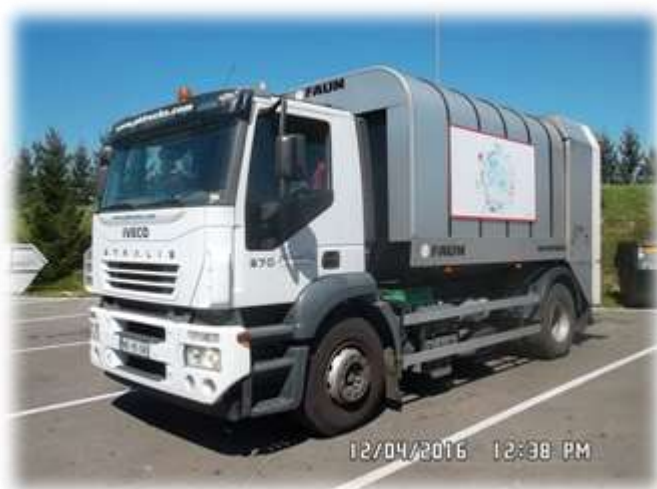
Slika 6: Vozilo za zbiranje mešanih komunalnih odpadkov

Za prevzemanje in prevoz mešanih komunalnih odpadkov se uporablja specialno vozilo in sicer: