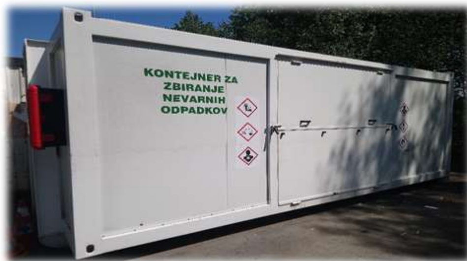
Slika 17: Kontejner za zbiranje in prevoz nevarnih odpadkov

Za zbiranje in prevoz nevarnih frakcij se uporabljajo specialna vozila s pokritim kesonom in dovoljenjem za prevoz nevarnih snovi. Vrste nevarnih komunalnih odpadkov, ki se lahko zbirajo s premično zbiralnico, so navedene v prilogi 5 letnega programa ločeno zbranih frakcij.