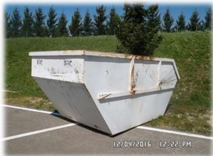
Slika 15: Kontejnerji za zbiranje kosovnih in preostalih odpadkov

Za prevzemanje in prevoz kosovnih odpadkov frakcij se uporabljajo kontejnerska vozila ter vozila za prevoz kotalnih prekucnikov.