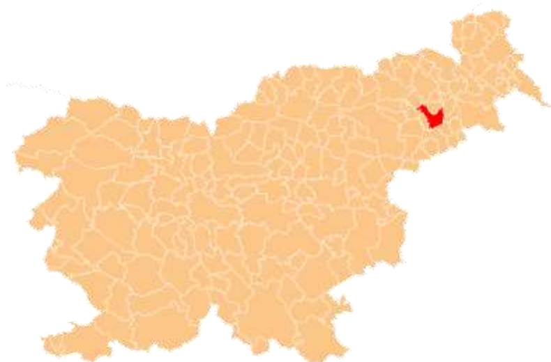
Slika 3: Lokacija Mestne občine Ptuj v RS