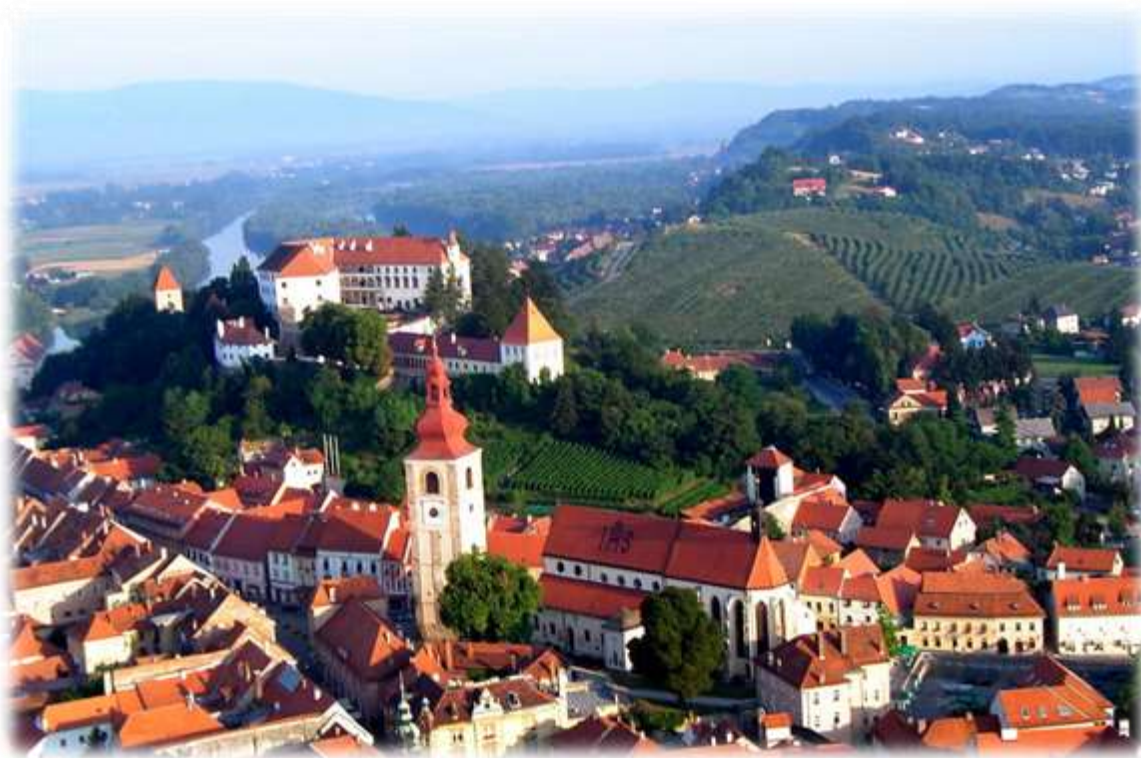
Slika 1: Mestna občina Ptuj