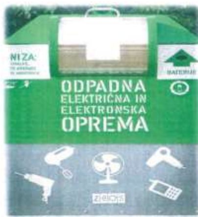
Slika 18:Zabojnik za zbiranje OEEO opreme

Glavni namen projekta E-cikliraj je zmanjšati količine nevarnih odpadkov, baterij, odpadne električne in elektronske opreme med preostankom odpadkov. V Mestni občini Ptuj se je v letu 2016 postavilo zabojnike za zbiranje omenjene opreme in baterij. Zbiranje v zelenih zabojnikih se bo nadaljevalo tudi v letu 2018, prav tako tudi vse spremljevalne delavnice, akcije osveščanja in obveščanja.