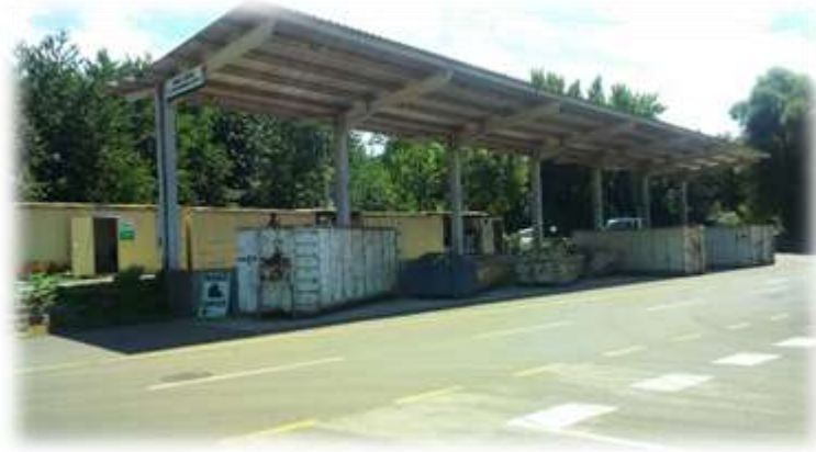
Slika 19: Zbirni center na CERO Gajke