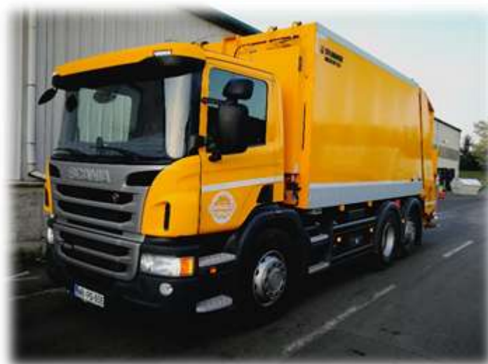
Slika 12: Vozilo za zbiranje ločeno zbrane odpadne embalaže