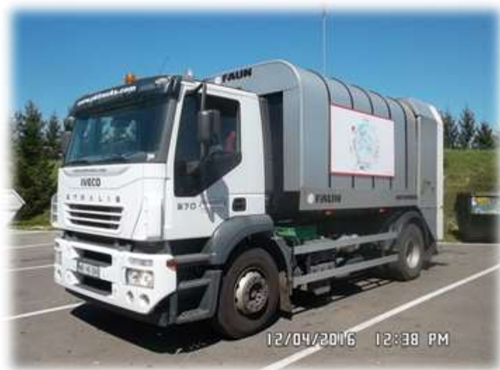
Slika 9: Vozilo za zbiranje bioloških odpadkov