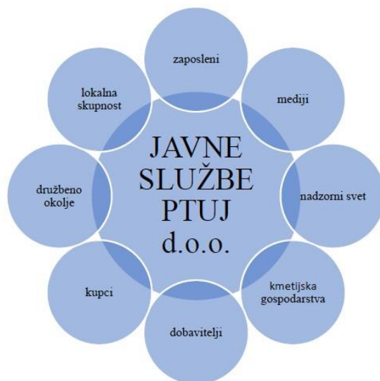
Slika 2: Deležniki družbe

Dejavnost družbe zadeva izjemno širok krog deležnikov. Deležniki družbe so vsi posamezniki, podjetja, organizacije, društva in lokalna skupnost, ki vplivajo ali so vplivani s strani družbe. Deležniki so izbrani glede na vpliv, ki ga ima družba na njih, in glede na to, kakšen vpliv imajo posamezniki na družbo.